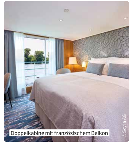
MS Swiss Splendor ♦♦♦♦

Die MS SWISS SPLENDOR gehört seit 2013 zur Scylla-Flotte und wurde 2024 renoviert. Sie bietet Platz für 174 Gäste in 94 Kabinen. Die Kabinen auf dem Diamant- und Rubindeck verfügen über französische Balkone. Alle Kabinen sind mit Flachbildfernseher, Minibar, Tresor, Haartrockner, Klimaanlage, Telefon, (Regen-)Dusche und WC ausgestattet.